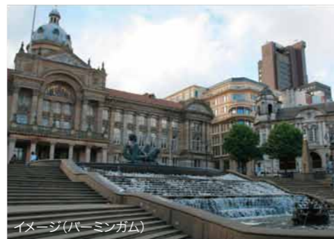
イメージ(バーミンガム)