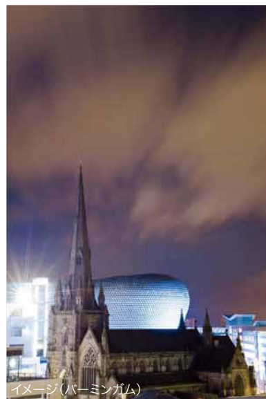
イメージ(バーミンガム)