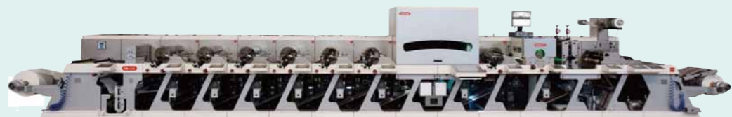
コンビネーションフレキソ印刷機「FA-Line」

ナローウェブ(狭幅輪転印刷機)に特化し、各種印刷方式を組合わせたコンビネーション印刷機が特徴的。タイ18台、中国20台、オーストラリア50台などアジア、オセアニア地区で100台を超える実績。年間150台の印刷機を出荷している。メディアテクノロジージャパンが2007年にニールピーター社との間で日本国内における総代理店契約を締結。