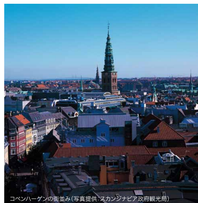
コペンハーゲンの街並み

本ツアーお申し込みの際、「MTマイレージポイント」によるキャッシュバックのご利用もできます。