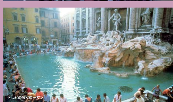
トレヴィの泉<ローマ>