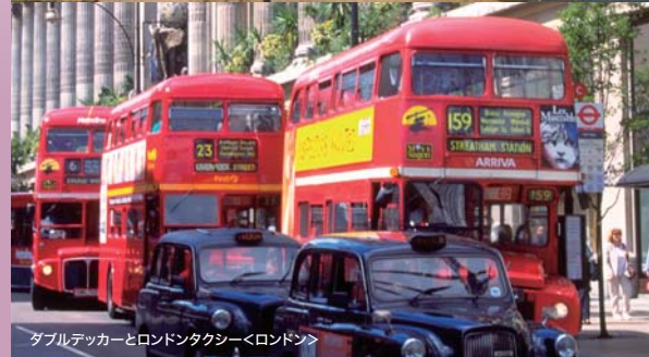
ダブルデッカーとロンドンタクシー<ロンドン>