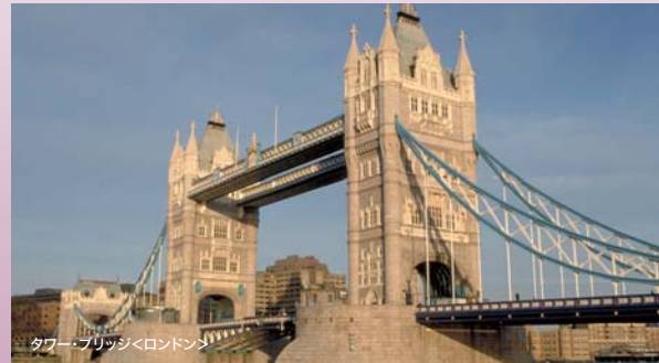
タワーブリッジ<ロンドン>