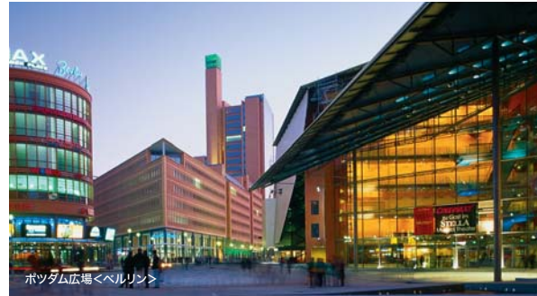
ポツダム広場<ベルリン>

時間帯のめやす 早朝 朝 午前 午後 夕刻 夜 深夜 04:00 06:00 08:00 12:00 16:00 18:00 23:00 04:00