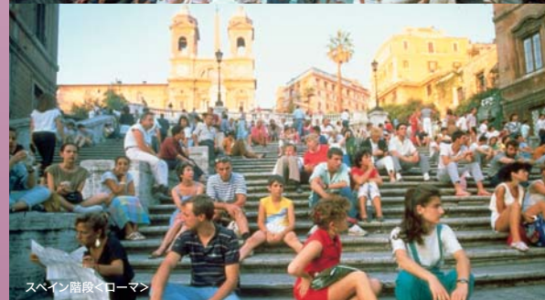
スペイン階段<ローマ>