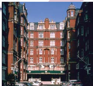
JOLLY HOTEL ST. ERMINS ウエストミンスターの閑静な一角に建つ、伝統的な英国調の堂々としたたずまいのホテルです。