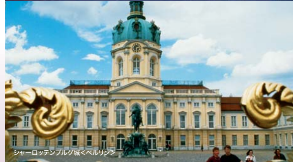
シャーロットンブルグ城<ベルリン>