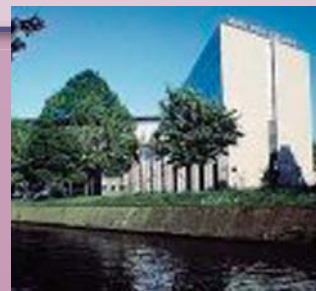
GRAND HOTEL ESPLANADE ランドベール運河沿いに建つスタイリッシュなデザインの高級ホテルです。